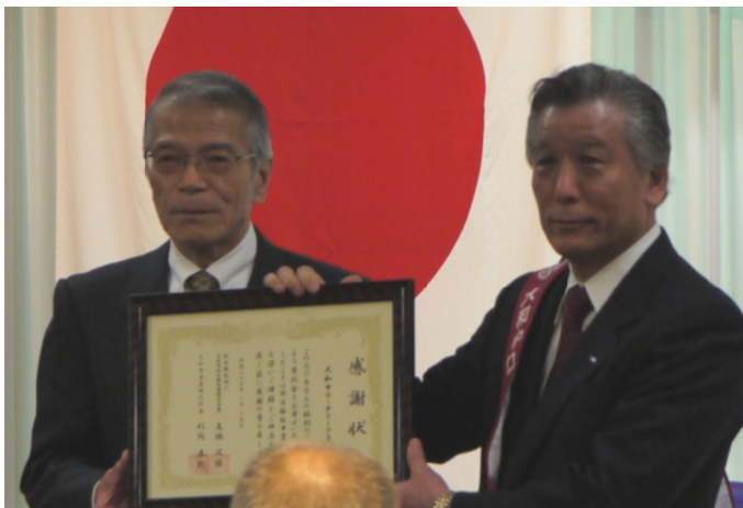
大和市社会福祉協議会 様