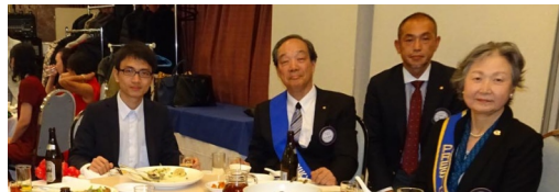
下 ダンス同好会 による パフォーマンス