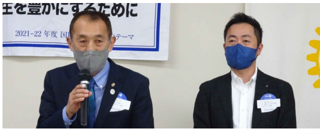
ガバナー補佐引き継ぎのご挨拶