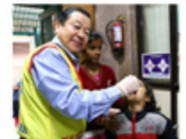
ポリオワクチン経口投与活動終了した笑顔の管轄 Kingdom of Dreams にて